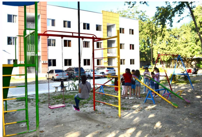
Niños residentes de la primera etapa de Condominios, jugando en un área común.

Con el conjunto habitacional Condominios Hábitat de la Cordillera, se busca fortalecer las capacidades individuales y comunitarias en materia de Convivencia y Cultura de Paz para una gestión del bienestar colectivo.